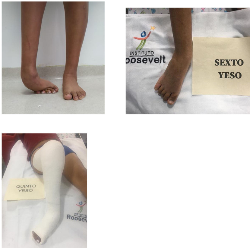
Figura 3 paciente de 14 años con PEVC derecho sin tratamiento, manejado con MP quien se logro corrección al sexto yeso, realizándose cirugía con tenotomía percutánea del Aquiles y transferencia del tibial anterior a 3 cuña.