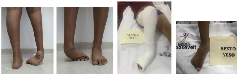
Caso 4: paciente de 14 años con PEVC derecho no tratado en manejo con MP, 6 yesos, tenotomía de Aquiles y transferencia de tibial anterior