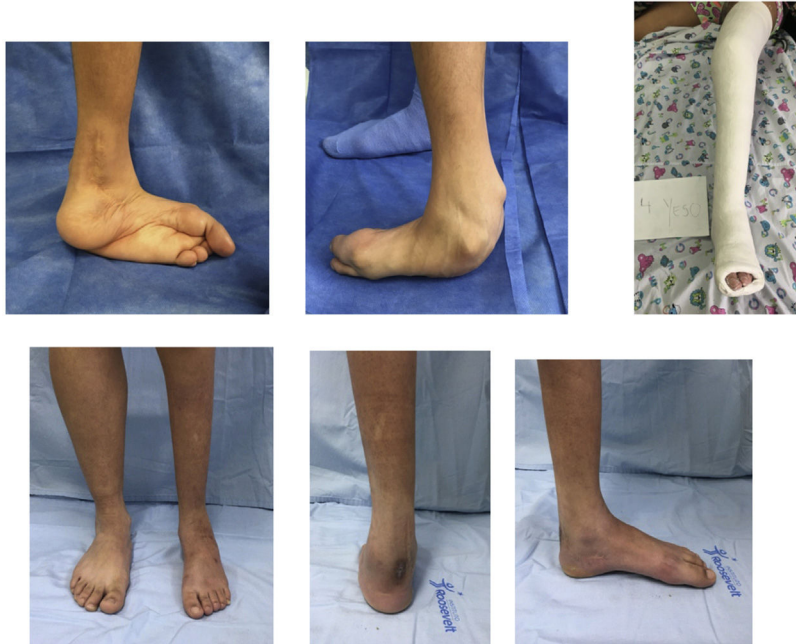
Caso 1: paciente de 16 años, con pie equino varo izquierdo no tratado manejado con MP, 10 yesos y posterior tenotomía de Aquiles mas transferencia de tibial anterior