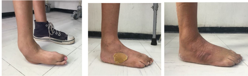
Figura 2 paciente de 19 años con pie equino varo derecho manejado con MP, tenotomía del Aquiles y transferencia de tibial anterior a 3 cuña, donde se observa zona de presión en región lateral del dorso del pie y reabsorción de la misma en un espacio de 3 meses luego de la cirugía.