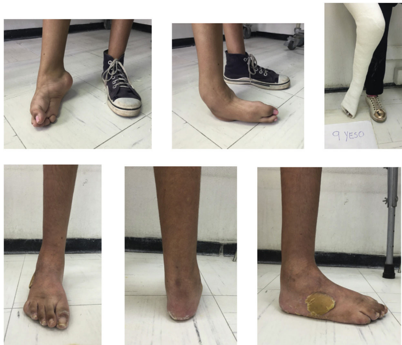
Caso 2: Paciente 19 años con PEVC derecho, no tratado en manejo con MP, 10 yesos, tenotomía de Aquiles, transferencia de tibial anterior