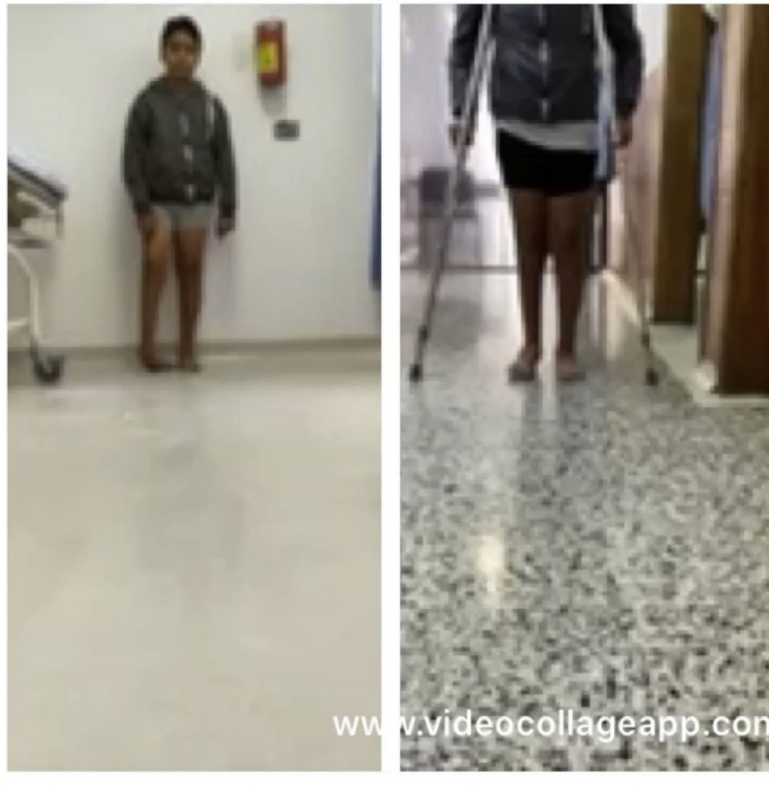
Caso 4: paciente 14 años, con PEVC derecho no tratado manejado con MP, 6 yesos y posterior tenotomía de Aquiles mas transferencia de tibial anterior

El futuro es apuntar a que con la instauración de las clínicas Ponseti, apoyados por programas nacionales coordinados, se logre una sociedad libre de PEVC posterior a la edad de inicio de la marcha, que permitan obviar estos protocolos en adultos. Se debe realizar estudios multicéntricos en pacientes adultos estableciendo protocolos para la inmovilización seriada de las extremidades apoyados por medicina interna, para evitar riesgo de complicaciones secundarias en la edad adulta, como la trombosis venosa y el riesgo de osteoporosis por desuso, la estandarización del manejo quirúrgico en el paciente adulto y además se recomienda el entrenamiento formal de este método a los cirujanos de pie de adultos para concientizarlos de las bondades de este tratamiento.