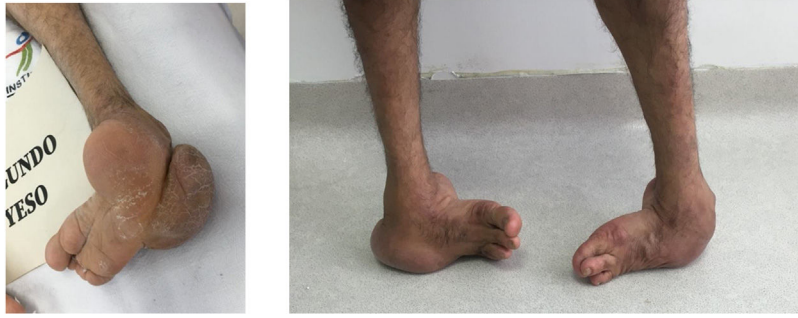
Figura 1 paciente de 66 años con PEVC bilateral sin tratamiento con higroma dorsal por apoyo patológico.